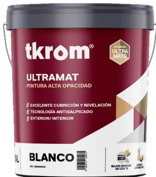
Figura 2: TKROM ULTRAMAT EN FORMATO DE 15L

Descripción del producto: El producto analizado es una pintura con excepcionales propiedades de opacidad, nivelación y lavabilidad (CLASE 1). Especialmente indicada para el pintado de áreas muy amplias y luminosas que requieren de un acabado mate sin reflejos. En su formulación incorpora la innovación reológica anti salpicado de tkrom pinturas, que reduce las salpicaduras hasta en un 80% respecto a una pintura convencional.