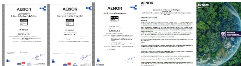
Figura 1: Certificados ISO 9001, ISO 14001, Huella de Carbono. Declaración de verificación de inventario de gases de efecto invernadero del año 2023 y Memoria de Responsabilidad Social Corporativa 2023