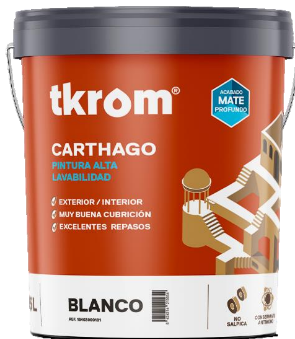
Figura 2: TKROM CARTHAGO EN FORMATO DE 15L

Descripción del producto: El producto analizado es una pintura de acabado mate profundo, que ofrece excepcionales propiedades de aplicación. Su extraordinaria lavabilidad confiere a los parámetros aplicados una excelente resistencia al paso del tiempo. Incorpora una innovación reológica en su formulación que reduce el salpicado.