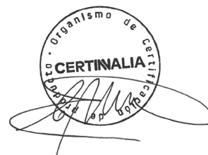
Carlos Nazabal Alsua Manager

Issued date / Fecha de emisión: 09/12/2024 Update date / Fecha de actualización: 09/12/2024 Valid until / Válido hasta: 05/12/2029 Serial Nº / Nº Serie: EPD0722500-E