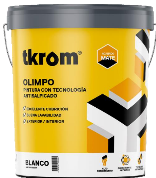
Figura 2: TKROM MATE OLIMPO EN FORMATO DE 15L

Descripción del producto: El producto analizado es una pintura plástica mate a base de copolímeros acrílicos, de acabado mate. Con tecnología anti salpicado. Excelente equilibrio entre aplicación, cobertura, rendimiento y lavabilidad. Idónea para uso profesional. Bajos niveles de COV'S y libre de amoniaco.