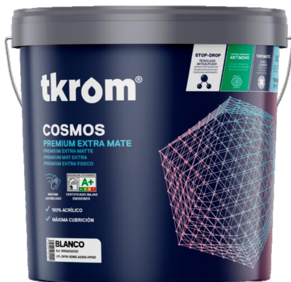
Figura 2: TKROM COMOS EN FORMATO DE 12L

Descripción del producto: El producto analizado es una pintura de acabado mate profundo, que ofrece excepcionales propiedades de aplicación. Su extraordinaria lavabilidad confiere a los parámetros aplicados una excelente resistencia al paso del tiempo. Incorpora una innovación reológica en su formulación que reduce el salpicado.