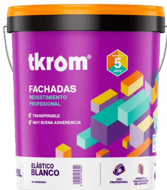
Figura 2: TKROM REVESTIMIENTO PÉTREO ELÁSTICO EN FORMATO DE 15L

Descripción del producto: El producto analizado es un revestimiento pétreo de gran elasticidad, fabricado a base de resinas acrílicas fotorreticulables de máxima resistencia a los agentes atmosféricos. Posee la propiedad de deformarse siguiendo los movimientos de dilatación y contracción de las fachadas, sin romperse ni agrietarse. Al secar proporciona una película de gran espesor y elasticidad y excelente impermeabilidad. Debido a su reticulación por radiación ultravioleta, posee gran resistencia al ensuciamiento.