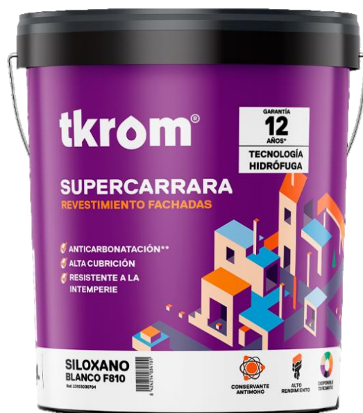
Figura 2: TKROM SUPERCARRA SILOXANO EN FORMATO DE 15L

Descripción del producto: El producto analizado es un revestimiento liso a base de siloxanos, para la protección y decoración de fachadas. Proporciona hidrofobicidad, aumentando la repelencia y transpirabilidad del agua, con una elevada resistencia al agua. Autolimpiable. Elevada resistencia a la luz solar, lluvia, suciedad ambiental, mohos, algas, contaminación, agentes atmosféricos y a la meteorización.