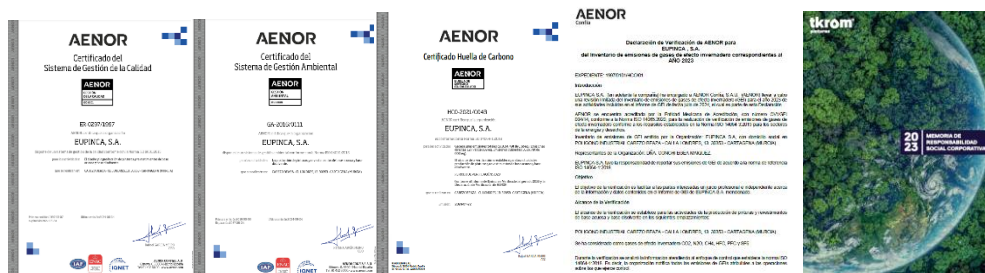
Figura 1: Certificados ISO 9001, ISO 14001, Huella de Carbono. Declaración de verificación de inventario de gases de efecto invernadero del año 2023 y Memoria de Responsabilidad Social Corporativa 2023