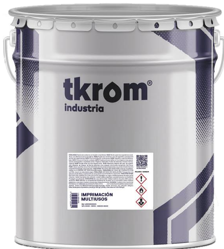
Figura 2: TKROM ESMALTE METRACRILICO GALVANIZADOS EN FORMATO DE 4L

Descripción del producto: El producto analizado es un esmalte acrílico base disolvente de excelente adherencia sobre acero galvanizado, buen brillo y excelente resistencia a los agentes químicos, así como al agua, a la intemperie y a la corrosión. Muy buena resistencia a la abrasión y al desgaste. Producto integrado en el Sistema Colorimétrico TKROM COLOR, lo que permite obtener una amplia gama de colores.