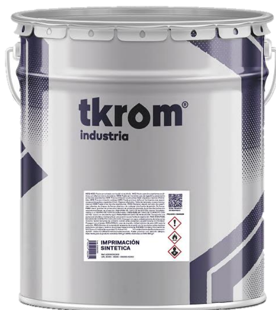
Figura 2: TKROM IMPRIMACIÓN SINTÉTICA EN FORMATO DE 15L

Descripción del producto: El producto analizado es una imprimación sintética de muy buena brochabilidad y gran facilidad de aplicación. Su gran poder de nivelación permite obtener a brocha o rodillo perfectos acabados, sin tendencia a descolgar. Fabricado a base de resinas gliceroftálicas de excelente secado en profundidad y muy buena dureza y flexibilidad.