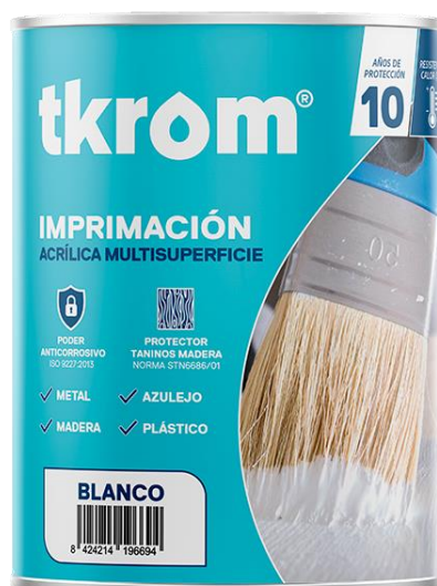
Figura 2: TKROM IMPRIMACIÓN MULTISUPERFICIE EN FORMATO DE 2,5L

Descripción del producto: El producto analizado es una imprimación multisuperficie de secado rápido a base de resinas acrílicas puras. Posee un excelente puente de adherencia sobre múltiples superficies: PVC, policarbonato, poliestireno, polietileno, aluminio, acero, galvanizado, madera, melamina, contrachapado, azulejo, etc. También sobre superficies como yeso o pladur. Con pigmentos anticorrosivos para garantizar una alta resistencia a la corrosión. Gran capacidad de sellado y tapaporos para madera, contiene aditivos antitaninos para el pintado de maderas que presenta exudaciones. Apto como capa de imprimación para el pintado de radiadores, no amarillea con la temperatura.