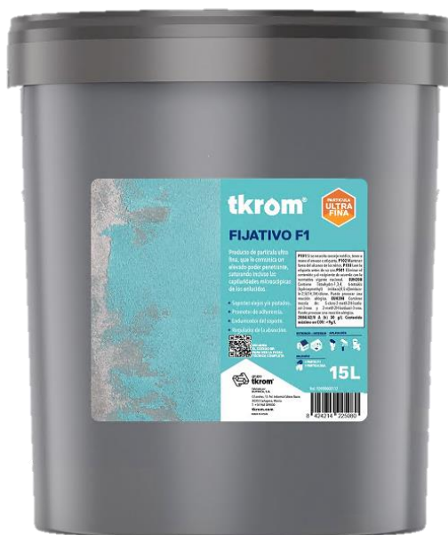
Figura 2: TKROM FIJATIVO F-1 EN FORMATO DE 15L

Descripción del producto: El producto analizado es un fijativo mural al agua de alta penetración, de base acrílica, para impregnación superficial de los soportes comúnmente utilizados en la construcción. Producto de partícula ultra fina, que le comunica un elevado poder penetrante, saturando incluso las capilaridades microscópicas de los enlucidos. Adecuado especialmente para consolidar y reforzar enlucidos de cemento, yeso, así como pinturas viejas caleadas. Posee una magnífica resistencia a la alcalinidad, siendo el soporte ideal de las sucesivas capas de pintura a aplicar sobre enlucidos de cemento, yeso, escayola, placas de fibra-cemento, etc.