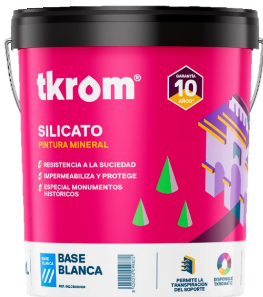
Figura 2: TKROM PINTURA AL SILICATO TKROM SIL EN FORMATO DE 15L

Descripción del producto: El producto analizado es una pintura mono componente de alta calidad, a base de silicatos, que petrifica con el sustrato mineral sobre el que se aplique, produciéndose una reacción de solidificación controlada, que proporciona una película muy resistente de aspecto mineral. Tiene gran capacidad de penetración y es de larga duración. No cuartea, e impermeabiliza y protege las superficies pintadas contra la agresividad de los agentes atmosféricos. Favorece el equilibrio termo higrométrico de los muros y paredes por la excelente transpirabilidad que le proporciona su estructura microcristalina originada por la precipitación de la sílice coloidal. Cumple la norma DIN 18363.