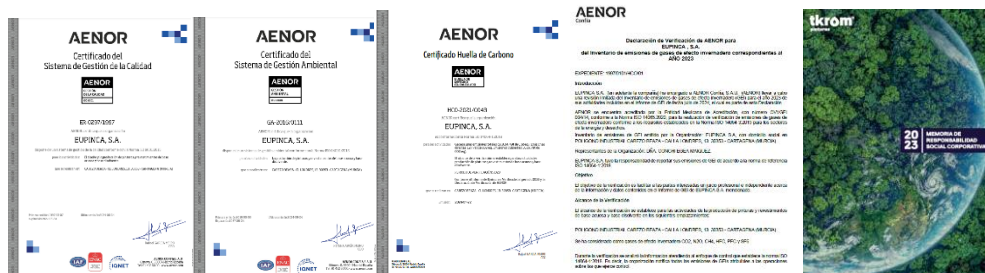
Figura 1: Certificados ISO 9001, ISO 14001, Huella de Carbono. Declaración de verificación de inventario de gases de efecto invernadero del año 2023 y Memoria de Responsabilidad Social Corporativa 2023