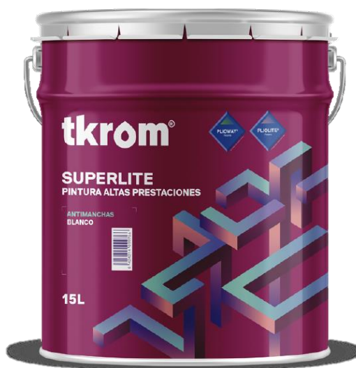
Figura 2: TKROM IMPRIMACIÓN SUPERLITE EXTERIOR EN FORMATO DE 15L

Descripción del producto: El producto analizado es una imprimación para fachadas, a base de resinas especiales en disolución. Por su excepcional adherencia, capacidad de penetración y resistencia a los agentes alcalinos, así como su estructura microporosa, que permite que el soporte respire, es la capa de fondo idónea para el posterior pintado con TKROM SUPERLITE EXTERIOR.